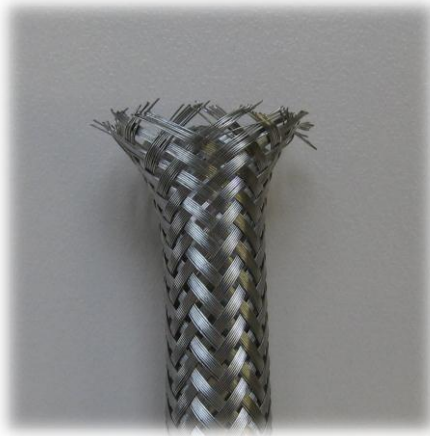
Geflecht tulpt nach dem Schneiden auf

Neben Schlauchumflechtungen produzieren wir loses Nirogeflecht als Meterware im Durchmesserbereich von 0 bis 150 mm. Wir können jetzt eine technische Lösung zum Fixieren der Enden anbieten. Das Verfahren ist bis zu einem Durchmesser bis 30 mm anwendbar. Durch fixierte Geflechsenden wird die unerwünschte Auftulung vermieden und eine wirtschaftliche Weiterverarbeitung von Schlauchgeflechtsstücken ermöglicht.